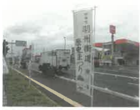
羽州街道歴史祭り