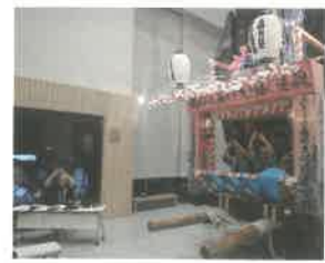
あきたまるごと オンラインフェス